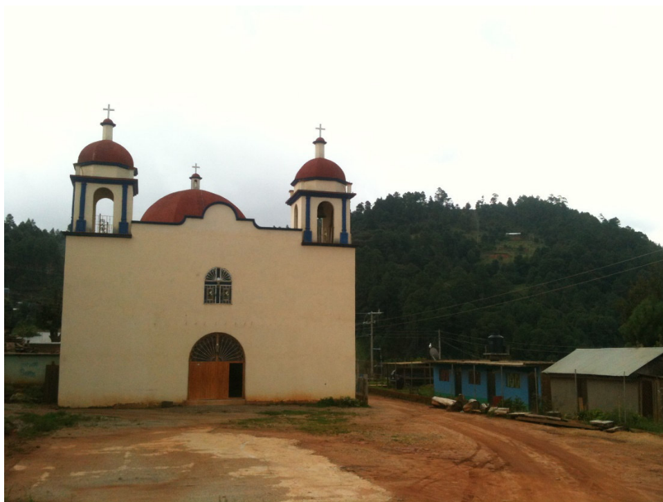
Templo católico de San Sebastián Río Hondo

construcciones se han dispuesto sobre el antiguo templo y otras veces se reubicaron en un lugar más apto.