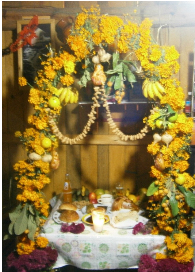
Las ofrendas de la Sierra Sur

el panteón, limpian sus tumbas o algunos les ponen flores a los difuntos, pero no hacen ninguna ofrenda en casa o ritual.