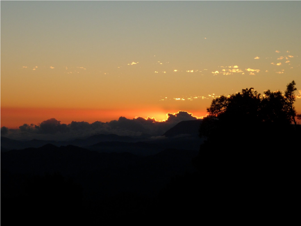
Vista al Mar: Hacia donde apunta el Corral de Piedra

Es donde los seres humanos colocaron, adornaron, indicaron y direccionaron a su numen para tenerlo como su aliado y beneficiario. Los especialistas rituales cuidan el lugar, lo mantienen escondido de extraños o enemigos como son los protestantes, para que la serpiente-guardián los siga proveyendo de aquello que los mantiene vivos y permite la reproducción no solo biológica sino también cultural, que hace pervivan sus costumbres y por ende su identidad como zapotecos serranos.