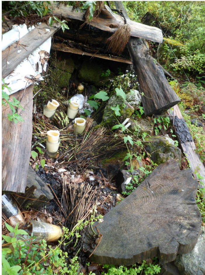
Las velas del Corral

zapotecos de nuevo. La vida en general se seguía reproduciendo gracias a sus creencias y el modo tradicional campesino seguía de pie.