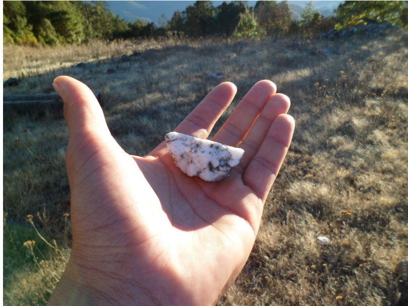
Pedernal intemperizado característico de la Cerbatana

del Cerro del Rayo desde una perspectiva geofísica ya que la altura es uno de los elementos fundamentales para que se pudiera dar la particular caída de rayos en el sitio. Por otro lado, habría también que destacar sus potencialidades geológicas como posible pararrayos natural 117 .