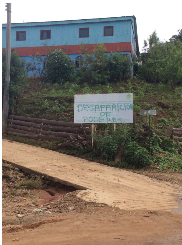
Desaparición de poderes

Las diferencias religiosas trascienden todos los ámbitos de la vida comunal. En los últimos años, muchos pueblos que se regían por los usos y costumbres, han decidido " cambiar su forma de organización por la de los partidos políticos " 254 , esto reafirma que los problemas de las comunidades generan desigualdad y desintegración. Es evidente que solo es la culminación de los conflictos, donde los partidos políticos como el PRI tienen gran injerencia, una vez que los pueblos abandonan el usos y costumbres los recursos se distribuyen de forma desigual y los caciques y ciertas familias se vuelven más poderosas.