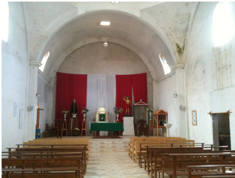
La Iglesia vacía

ceremonia, por lo que la gente generalmente tiene que ir a buscarlo a San Mateo. Entonces, es imposible que los pueblos tengan presencia de una autoridad religiosa a menos que sea un caso de suma importancia.