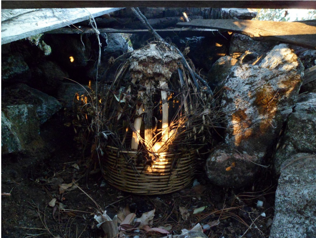
Canasta adornada con flores y llena de frutas

El corral del cerro de la Cerbatana fue en algún momento considerado el corazón del pueblo y donde habitaba el dios tutelar 133 , es la casa de la serpiente-guardián y es el lugar por donde esta entra y sale, es un umbral 134 de lo sagrado donde convive el ser humano y los númenes poderosos, es el lugar que permite al zapoteco convivir con la fuerza sagrada de la naturaleza 135 . Es el espacio