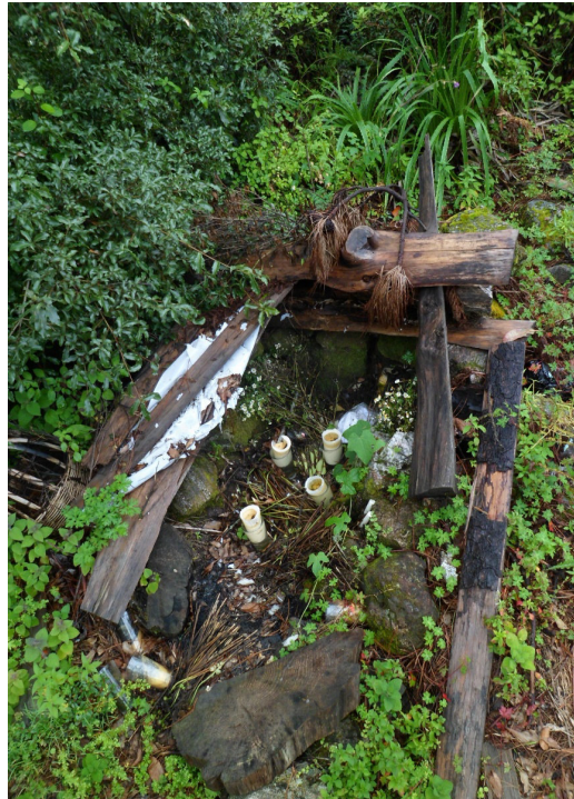
El Corral de Piedra

piedras se encontraba tapada con una lona y unas tablas para que se protegiera lo que estaba dentro de ella. Actualmente, se encuentra descubierta y en mal estado.