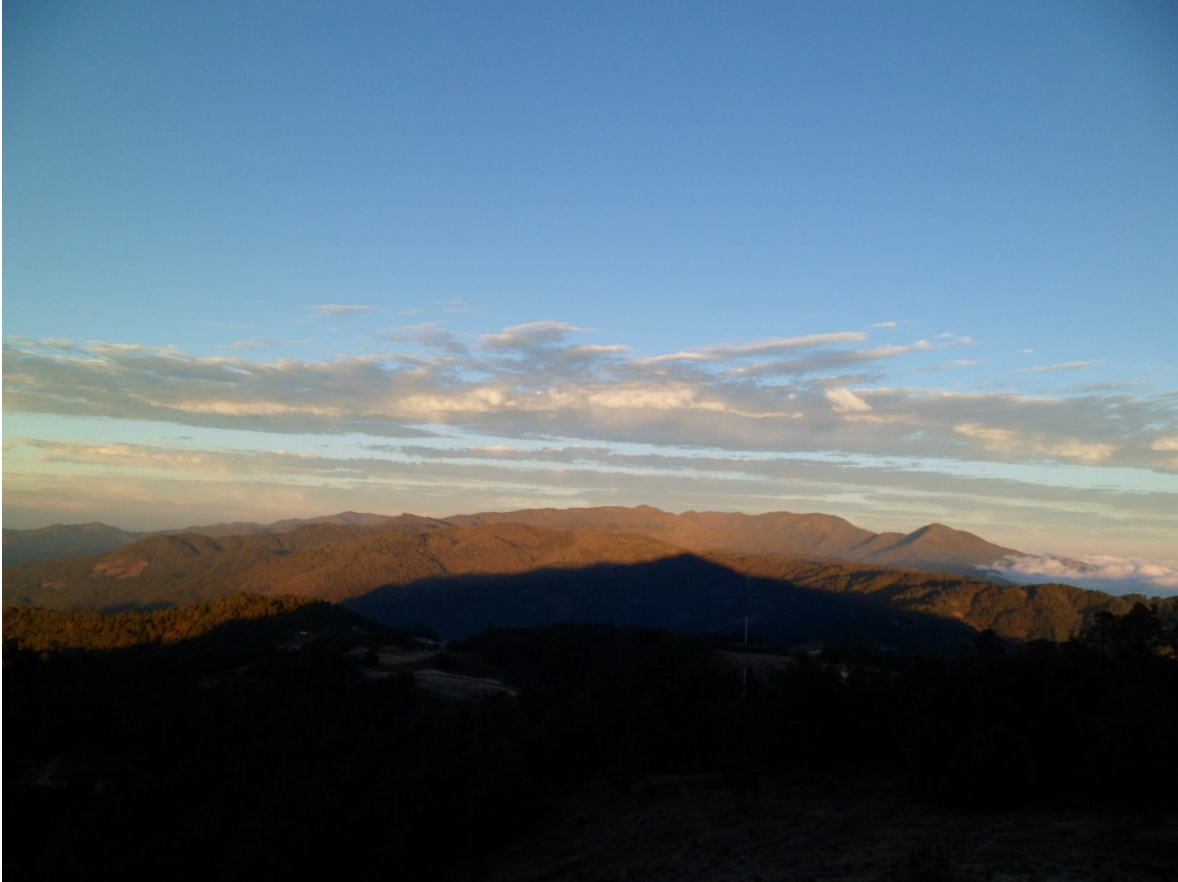
La Sombra de la Cerbatana sobre la Sierra 1