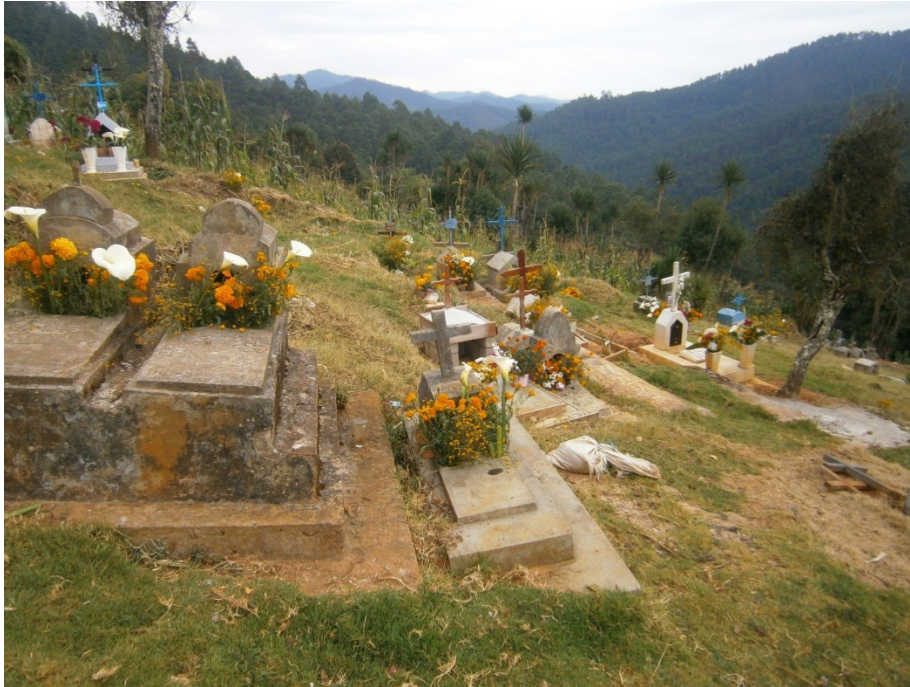
Panteón de San Sebastián Río Hondo

En los panteones no se hacen velaciones. Esto se debe a las condiciones climáticas, y tal parece que cada quien se toma su tiempo para visitar a su muerto. Hay una organización colectiva para limpiar el panteón con semanas de anticipación, algunas personas son las encargadas de ordenar el panteón antes del día de todos los Santos Difuntos. En otros poblados como San José se organiza un torneo femenino y varonil de Básquet Ball para conmemorar el día.