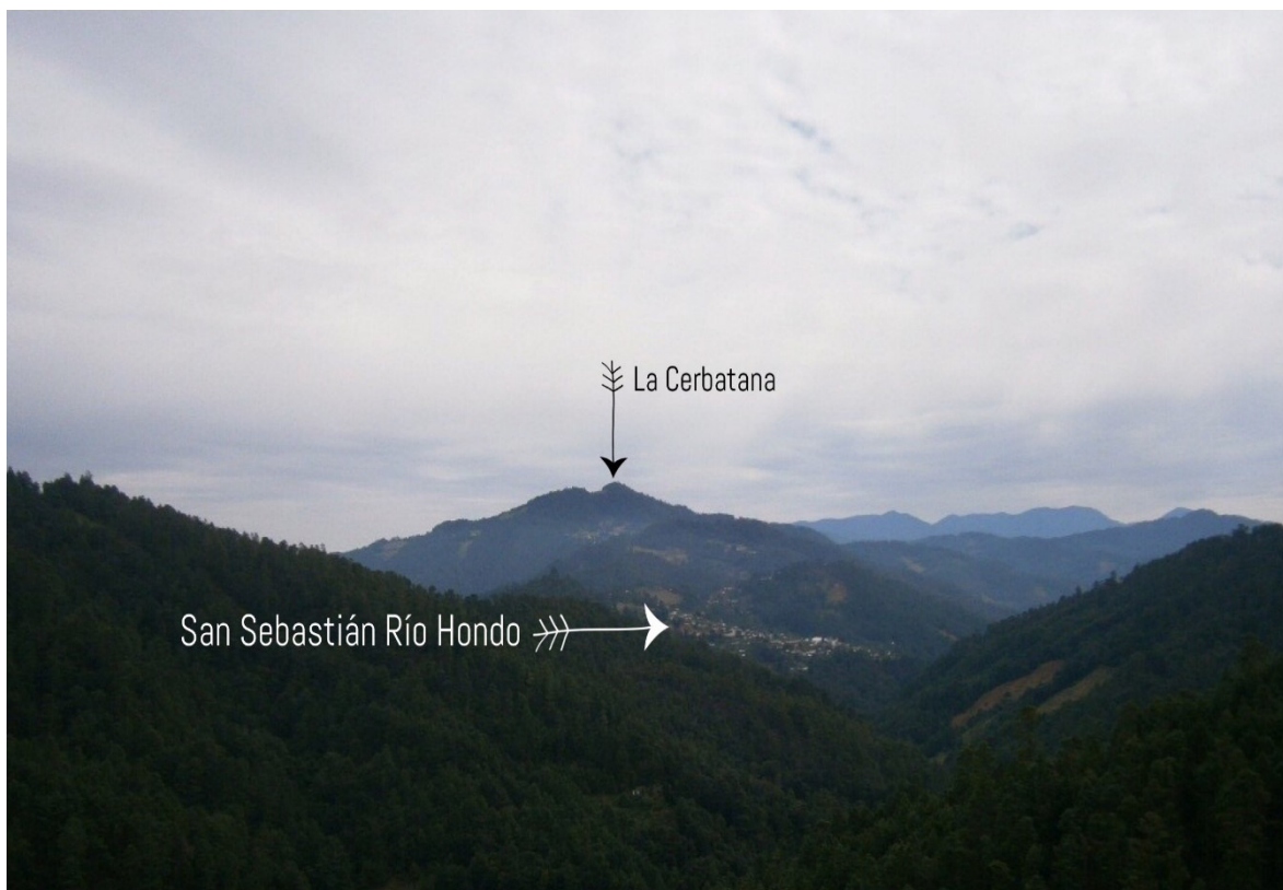
La Gran Montaña

sufrido múltiples transformaciones. Aunque si hay un pasado en común, lo que se ve hoy en día no es lo que hacían los zapotecos de la época precolombina. El culto al Rayo es parte herencia ancestral del culto a Cocijo pero tanto con la evangelización católica y actualmente la protestante es difícil decir que el Rayo es el Cocijo de los zapotecos precolombinos, más bien es un mitema 88 de aquel gran mito 89 de Bdao Gwizi'ó.