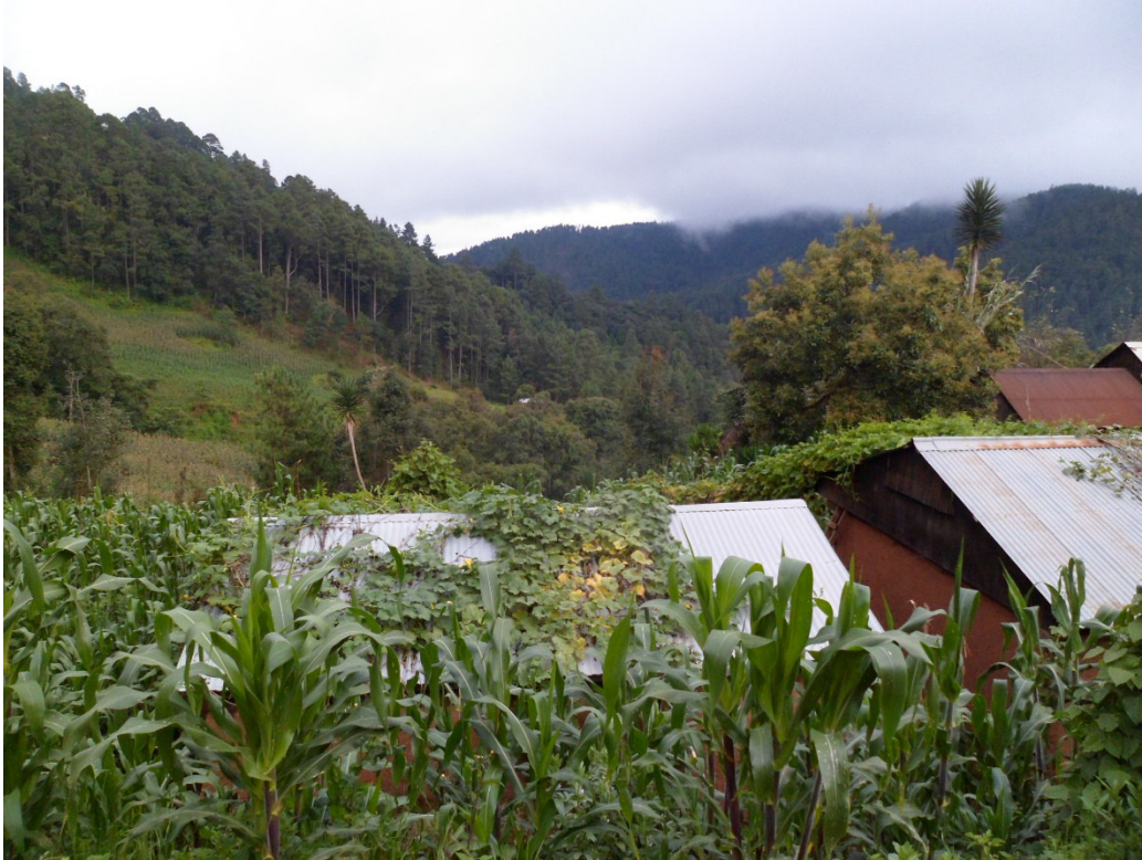
San Sebastián pueblo campesino

del cielo, observación de la naturaleza para lograr una buena cosecha, distinción de flora y fauna (aunado a las propiedades curativas o nocivas de las primeras), entre otros.