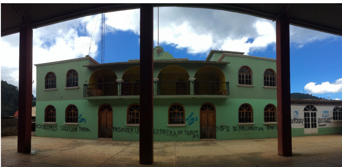
El palacio de gobierno tomado

están íntimamente interconectados, entonces, la crisis 252 religiosa impacta en todos los demás intereses sociales. Actualmente, San Sebastián se encuentra en un proceso de ingobernabilidad debido a que su presidente es evangelista y no es aceptado por la mayoría de los habitantes, el palacio de gobierno y todas sus oficinas se encuentran cerradas y debido al ambiente de tensión, el presidente y todos los funcionarios trabajan y fungen sus cargos desde la casa particular del presidente. 253