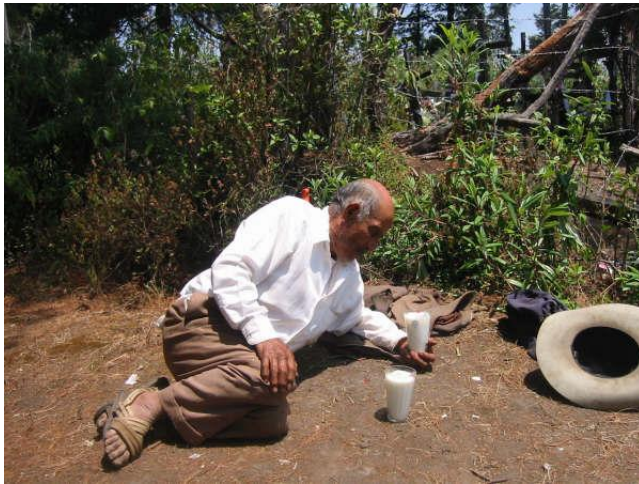
Fig. 1 Tiempereo de Ecatzingo, tratando de recibir los mandatos de las entidades espirituales para el inicio de un temporal fructífero para los lugares y demás pueblos comarcanos.

Muy recientemente hemos logrado que alguno de nuestros informantes acepte el método de la ingesta y el hecho no es de sorprender pues es una actividad cultural en la que subyace una ancestral cosmovisión que exige de esta práctica en los rituales. Sin el trance al mundo de la deidad no se tendría ninguna validez, sus actividades carecerían de sentido y significado.