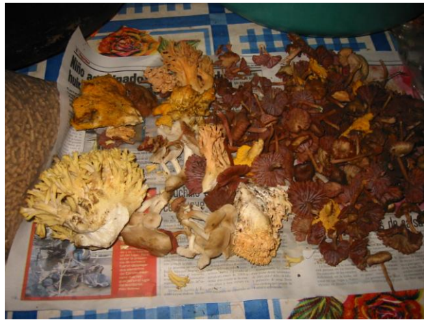
Fig. 6 diferentes hongos comestibles que son recolectadas en el paraje denominado Apapasco . En los que figuran las escobetillas, las trompetas y colorados.

crecen los diferentes hongos comestibles 64 que dan sustento a la dieta de los ecatzingas y son la morada de muchos animales voladores y terrestres como zenzontles, pájaros carpinteros, águilas, búhos, lechuzas, golondrinas, mariposas, conejos, ardillas, gusanos y demás animales que habitan los bosques de la Sierra Nevada.