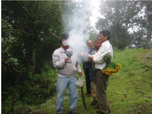
Fig. 8 tiemporos sahumando el arma con la que combatirán a los espíritus malignos que merodean las cumbres del Cempoaltepec .