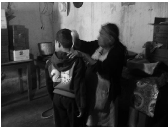
Fig. 3 chamana poniendo en equilibrio el espíritu de un niño que había perdido su fuerza a causa de un susto.

Diversos elementos operaban en las sociedades mesoamericanas que cohesionaban a unos pueblos con otros. Primero porque el imperio mexica al conquistar algún pueblo se adueñaba de sus deidades o insertaba en ellos otras nuevas, y segundo porque el trinomio hombre, naturaleza y cosmos, fue una ecuación que siempre formó parte de la identidad mesoamericana y que aun se ve reflejada en las prácticas rituales de los pueblos indígenas. Para realizar nuestro propósito iniciamos con una práctica etnográfica para corroborar la existencia de los rituales y la función del sueño en ellos, así como para medir los niveles de conciencia y de nitidez que estos rituales presentaban en el periodo prehispánico al momento del contacto. A partir de este trabajo se facilita el análisis de la práctica etnográfica.