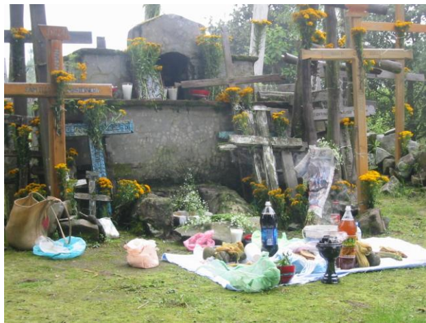
Fig. 15 Ofrenda donde se exponen los primeros frutos del maíz que serán ofrendados a las deidades del monte.