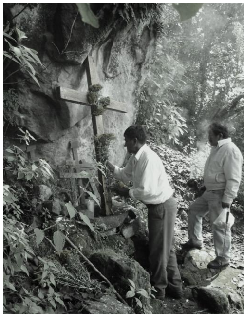
Fig. 13 Limpiando y tocando el “timbre”.

Posteriormente Don Epifanio dijo lo siguiente: