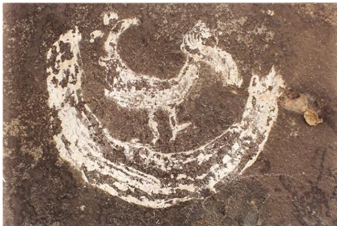
Fig. 5 pintura rupestre encontrada en la cueva del gallo localizado en la barranca que divide al estado de México y el estado de Morelos.

pinturas siempre hicieron en la cumbre de una montaña, en un despeñadero o en una barranca, es decir en sitios de difícil acceso; sólo aquellos a los que la tradición les asigna la fuerte tarea podían realizarlos u observarlos.