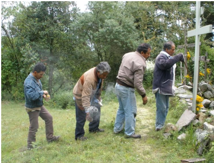
Fig. 16 Los misioneros del temporal abriendo los cabos de la tierra para que lleguen las aguas tardías y terminen de germinar las sementeras restantes.

En lo suave de su voz que dan sus flores, dos picos en un momento veloz, para Dios hace su sacrificio, en este nuevo día gracias, te tributamos o Dios omnipotente a ti señor de lo creado.