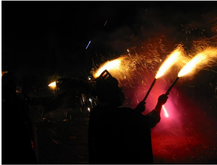
Fig. 2 final de la fiesta de los “12 pares de Francia” celebrada durante la fiesta del 28 de enero

San Miguel Arcángel, el 24 de junio en San Juan Tlacotompa se hacen celebraciones con misas, danzas y música, el 15 de agosto se festeja el día de la Asunción, el 11 de noviembre se celebra la fiesta de San Martín Obispo, el 16 de noviembre se celebra Santa Gertrudis, del 20 al 30 de noviembre fiesta de Todos Santos, el 8 de diciembre se celebra el día de la Inmaculada Concepción, el 24 de diciembre se celebra la Navidad.