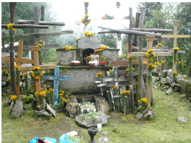
Fig. 11 Cruces adornadas con la flor de pericón en el día de San Miguelito.