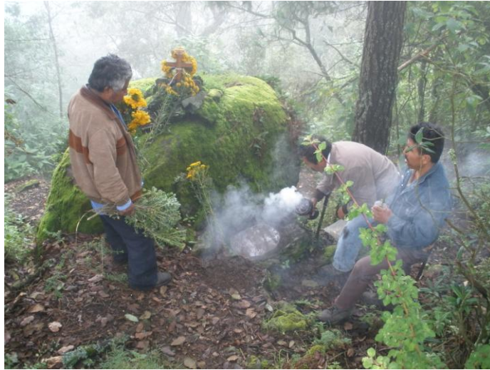
Fig. 12 limpiando y sahumando una de las piletas principales del calvario de Cempoaltepec y que se encuentra en la entrada al “timbre”.

Después de limpiar y poner agua limpia en la pileta que está junto a la piedra, se baja hacia otra gran piedra que tiene de altura alrededor de 2 metros y medio y de ancho 5 metros más o menos; en esta piedra se encuentra una oquedad a manera de triangulo donde reside una de las deidades principales del calvario en su condición de “aires”; esta piedra es denominada el “timbre” porque es aquí donde se pide con mayor ahínco el temporal o en su contraparte se dan las gracias por un muy buen temporal. Es aquí donde el “tiempero” tiene que limpiar y barrer como se hizo en el altar principal, además de ver que las cruces estén bien colocadas. En la ocasión que pudimos entrar con ellos al “timbre”, había una veladora encendida dentro de la oquedad donde habitan los “aires”, por lo que nos dijo el “tiempero” que eso era una maldad de gente que no quería que el temporal se llevara bien o para que haya sequías para el próximo año.