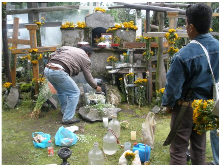
Fig. 14 Tapando la fuente de agua que regara los caminos de la tierra y del universo

Después de terminar de limpiar “el timbre”, el “tiempero” mayor sube a supervisar que la fuente al igual, que las cruces, se hayan limpiado correctamente, además de ser adornadas con la flor de pericón por ser el día de San Miguel, se disponen a cerrar los cabos de la tierra y sólo uno se queda en el altar principal, en este caso el cantor haciendo alabanzas hacia las deidades superiores. en este caso, el volcán Popocatepetl y Dios nuestro señor.