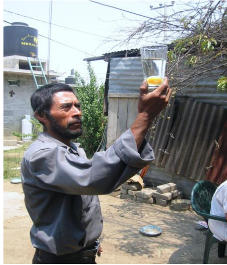
Fig. 4 medico tradicional tratando de diagnosticar a través de la lectura del huevo con agua.

Es de notar que ambos médicos o especialistas hacen uso del sueño; por un lado los que curan el entorno, requieren de revelaciones en sueños para curar a las fuerzas de la naturaleza, y por otro, quienes además curan al ser humano y a la sociedad. Así el sueño es un elemento básico que les hace tener mucho en común, ya que es el conductor de sus curaciones; por lo que pudimos observar en estas practicas que están muy mezcladas con elementos cristianos que se ven reflejados en las oraciones, cantos y en los nombres de los santuarios a los que muchas veces se les refiere con el nombre de “calvarios”, no dejan de manejar o tener como base una forma de herencia prehispánica que se explica primordialmente por el concepto de cosmovisión formulado por Johanna Broda (véase adelante). Estos lazos a los que los habitantes se encuentran muy bien agarrados desde épocas prehispánicas y que han sabido perdurar a través de los tiempos, han mantenido el orden y continuidad del pueblo, pero también gracias al núcleo que ha sabido amalgamar a los pueblos mexicanos y que ha sido el vértice que nutre la tradición y la historia mexicana.