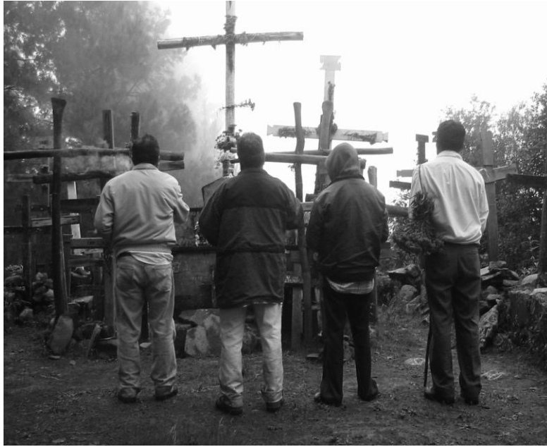
Fig. 17 Misioneros del temporal dando las gracias y cerrando el ciclo agrícola, además de pedir fuerza para continuar con el trabajo del próximo temporal.